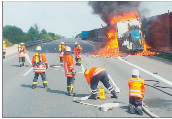
Einsatz auf der Autobahn A2.

Geschichtlich war das Feuerwehrwesen in der Gemeinde