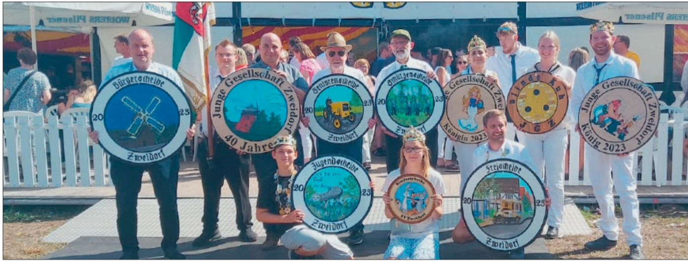
Die Zweidorfer Majestäten aus dem Jahr 2023

Zweidorf. Der Gedenksteintag ist in diesem Jahr erstmals der Auftakt für das Zweidorfer Volksfest. Am 22. August um 18 Uhr beginnt das Festwochenende mit gemütlichem Beisammensein am Gedenkstein an der Peiner Straße. Bei Bratwurst, Getränken und mit musikalischer Begleitung durch die Bortfeld-Bettmarer Blasmusik heißt die Traditionsgemeinschaft alle Gäste bei freiem Eintritt herzlich Willkommen.