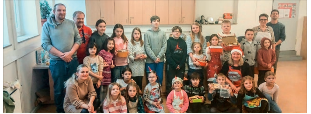
Die Gruppe der Bäckerinnen und Bäcker mit den Helferinnen und Helfern

Diekholzen. Die Backaktion für Kinder der AWO-Diekholzen war mal wieder ein großer Erfolg! 24 Kinder im Alter von 6 bis 13 Jahren sowie Helferinnen und Helfer des AWO-Ortsvereins haben sich in der Adventszeit der Grundschule Diekholzen zusammengefunden. Eifrig waren die kleinen Bäckerinnen und