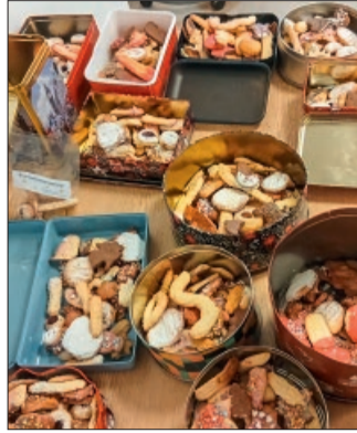
Die gefüllten Keksdosen

Diekholzen. Die Backaktion für Kinder der AWO-Diekholzen war mal wieder ein großer Erfolg! 24 Kinder im Alter von 6 bis 13 Jahren sowie Helferinnen und Helfer des AWO-Ortsvereins haben sich in der Adventszeit der Grundschule Diekholzen zusammengefunden. Eifrig waren die kleinen Bäckerinnen und