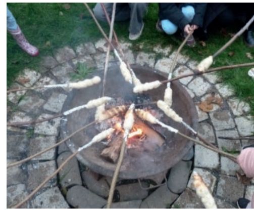
Text und Foto von Claudia Timpe

Wir freuen uns auf ein Kennenlernen und den Austausch mit Ihnen.