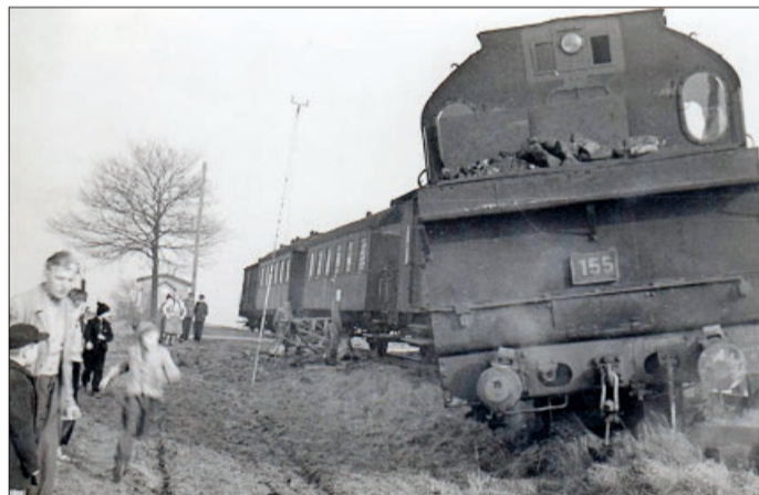
Weder der Schlepper noch der Zug konnten die Fahrt fortsetzen. Im Hintergrund ist der Haltepunkt Harber zu sehen. Einige Jungen schauen sich die entgleiste Lok aus der Nähe an.