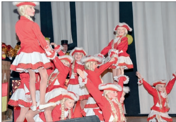
Mit dabei war auch die junge Funkengarde des Clubs.