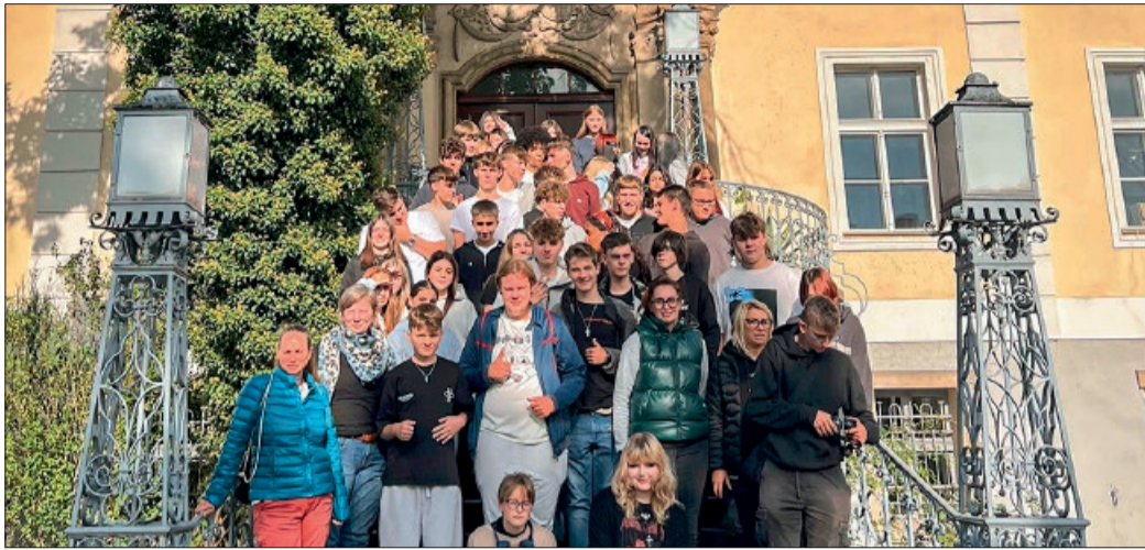
Die deutsch-polnische Jugend-Begegnungsgruppe

Lengede. Internationale Begegnungen sind aktueller und wichtiger denn je. Nach mehreren Schulaustauschfahrten in der Vergangenheit hat die IGS Lengede in diesem Schuljahr nun ein neues Ziel in Polen ausgemacht. Eine Gruppe von 28 Schülerinnen und Schülern entdeckte das Gut von Moltke in Krzyżowa (Kreisau), eine deutsch-polnische Jugendbegegnungsstätte und ein Ort mit Geschichte in Niederschlesien. Am ersten Morgen stand ein erstes Treffen mit einer gleichen Anzahl an polnischen Schülerinnen und Schülern der Zespół Szkół im. Marii Curie Skłodowskiej aus Szczawno-Zdrój an.