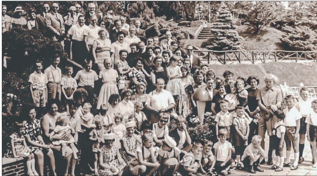
Ein historisches Schwarz-Weiß-Gruppenfoto von Witwen, Waisen und Geretteten mit einigen Offiziellen, nach dem Grubenunglück (Oktober 1963) beim Aufenthalt am nördlichen Ärmelkanal im Sommer 1964.