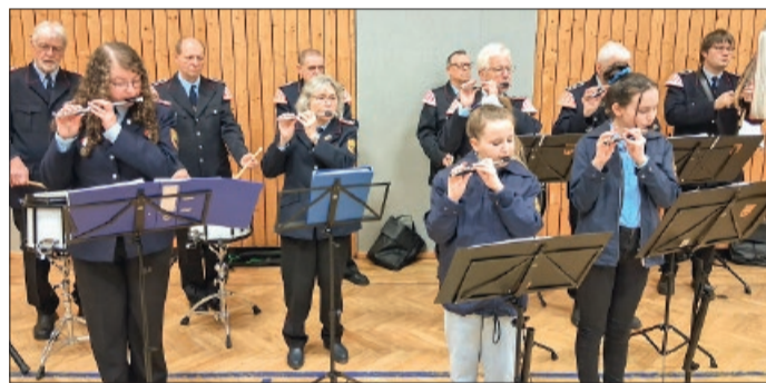
Traditionsgemäß umrahmte der Spielmannszug die Jahresversammlung der Freiwilligen Feuerwehr Woltwiesche musikalisch.