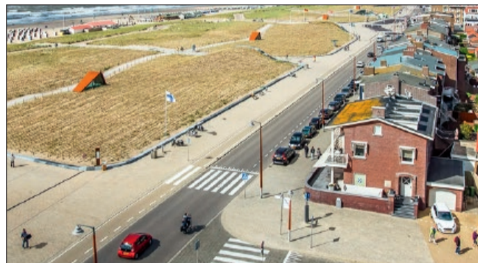
So präsentiert sich heute der Kurort, Seebad Katwijk Aan Zee, an der niederländischen Küste.

Text: Michael Kramer