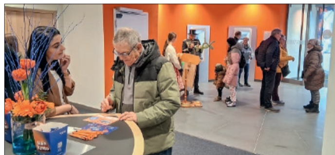
Interessierte Kunden ließen sich in der großzügigen Eingangshalle gerne informieren.

formte ein Ballonkünstler Träume aus eingepackter Luft, ein Holzelefant trug einen Schminktisch und auf dem nebenstehenden