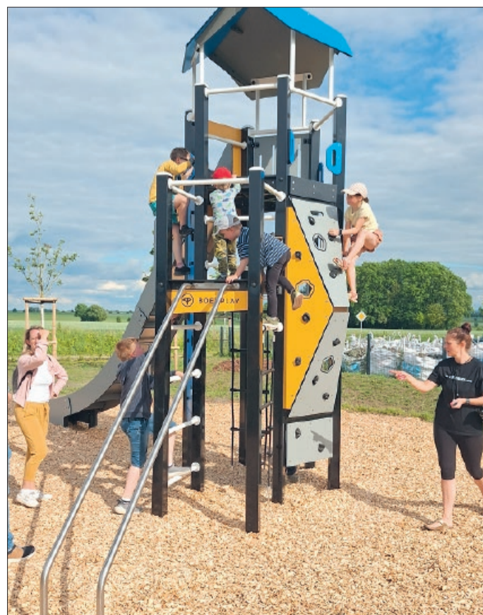
Das Klettergerüst wurde von den Kindern sofort in Beschlag genommen.