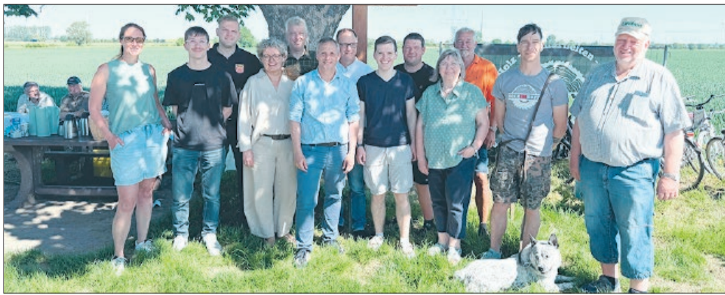
Die Bewohner aus den drei Ortschaften freuten sich beim Handweiser-Fest über die gelungene Aufstellung der hölzernen Hände unter dem Ahorn in der Feldmark.