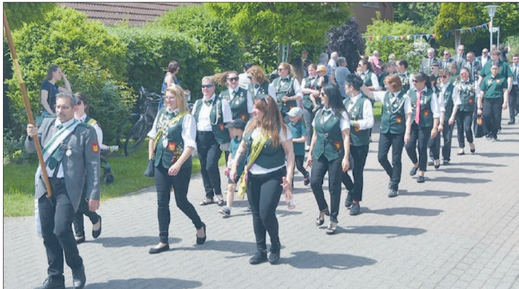
Besonders die Schützinnen und Schützen aus Bründeln waren beim Umzug stark vertreten.