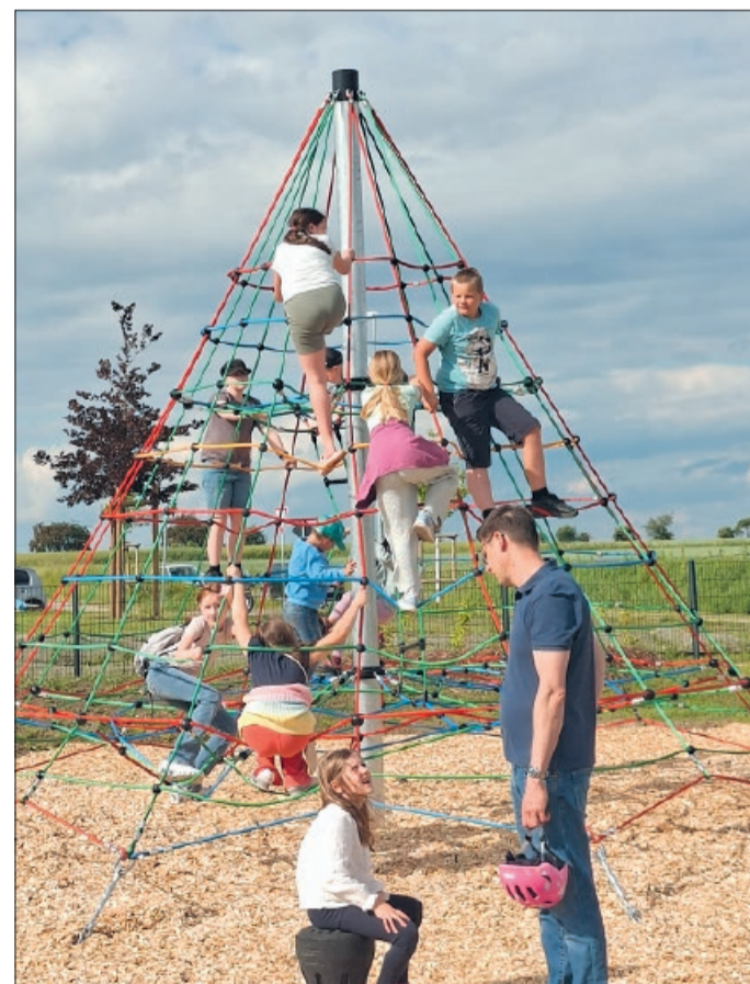
Auch an dem bunten Klettergerät herrschte sofort großer Andrang.