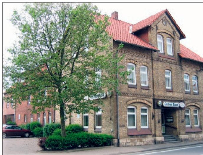
Gasthof Busse