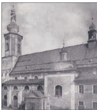
Katholische Pfarrkirche in Katscher, Kreis Leobschütz