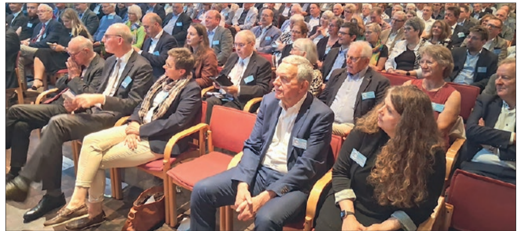
200 geladene Gäste haben im vollbesetzten Forum an der Jubiläumsfeier zu 80 Jahre CDU im Kreis Peine teilgenommen.