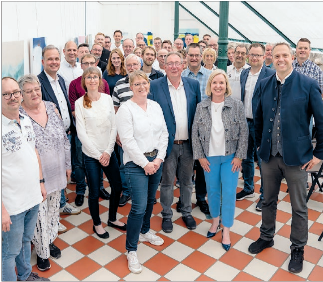
Das starke Team der CDU für die Kommunalwahlen in Holle.