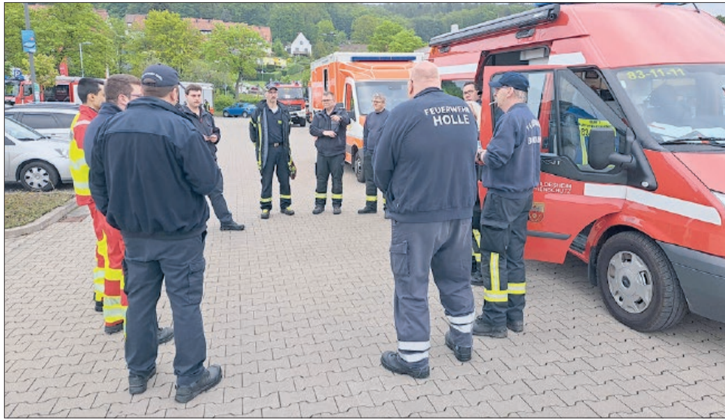
Kameraden und Fahrzeuge der Feuerwehr Holle im Bereitstellungsraum Wehrstedt bei Rewe