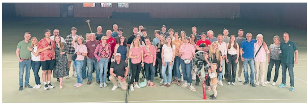
Gruppenfoto bei der Abschiedsparty der Holler Tennishalle.

Tennis wurde an diesem Tag aber nicht mehr gespielt. Alle nutzten die Gelegenheit, ein letztes Mal durch die Halle zu