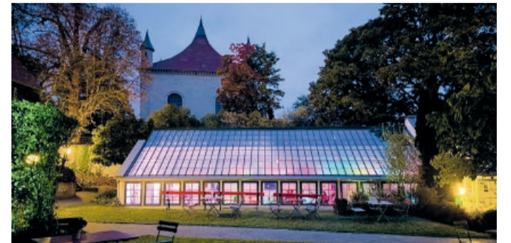
Kultur, Kunst und besondere Momente – ab August wieder im Glashaus Derneburg

Auch die Geschichte der Gemeinde steht 2026 im Mittelpunkt. Am 5. September feiert das Heimatmuseum Holle sein 40-jähriges Bestehen als Museum. Seit vier Jahrzehnten bewahrt es die Geschichte und Kultur der Region und macht sie für Besucherinnen und Besucher erlebbar. Dank des großen ehrenamtlichen Engagements hat sich das Museum zu einem wichtigen Ort der Erinnerungskultur entwickelt – und sorgt dafür, dass die