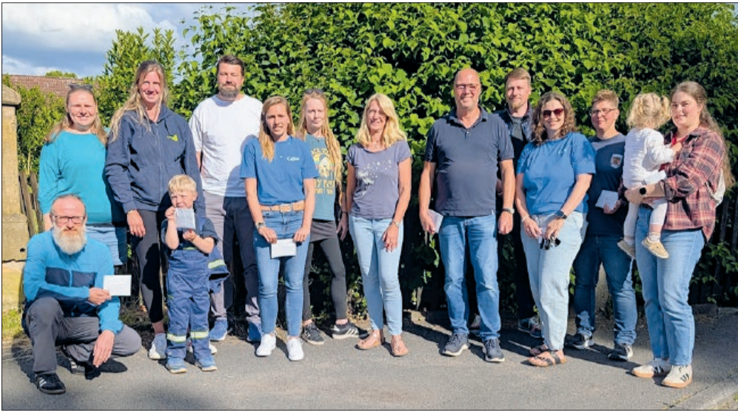
Die Vertreter der Helferinnen und Helfer mit den Organisatoren.