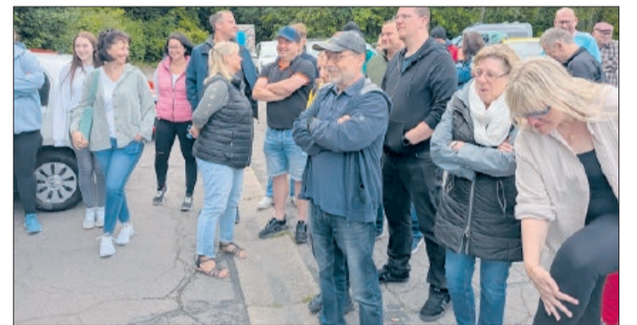
Die Teilnehmer vor dem Start.

Vereinsmeisterschaft und Saisonabschluss des TTC Heersum: