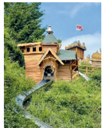
Familienpark Sottrum