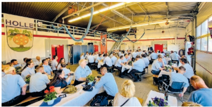
Volles Haus, große Wertschätzung und ein klares Bekenntnis zum Ehrenamt: Ende Mai 2026 hat die Gemeinde Holle die ehrenamtlichen Einsatzkräfte ihrer Ortsfeuerwehren feierlich geehrt

des Bevölkerungsschutzes im Zuge des Operationsplans Deutschland wurde thematisiert. Feuerwehren müssten sich heute auf Szenarien vorbereiten, die noch vor wenigen Jahren kaum vorstellbar erschienen.