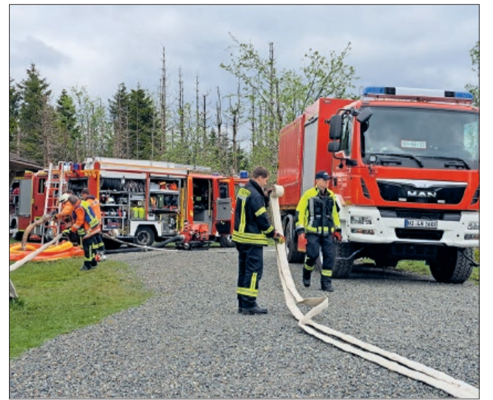
Verlegen einer langen Wegstrecke mit SW KatS

reichhaltigen Frühstück. Nach der Lageeinweisung ging es zum Schloss Herzberg. Ein Feuer in dem darunterliegenden Bauhof breitete sich rasend schnell durch den Wald in Richtung Schloss aus. Ein Gebäudeteil hatte bereits durch Funkenflug Feuer gefangen und Besuchern wurde dadurch der Rückweg ins Freie abgeschnitten. Die einzelnen Züge wurden zur Wasserförderung über 600m, zum Aufbau einer Riegelstellung zur Sicherung des Schlosses sowie zur Menschenrettung und