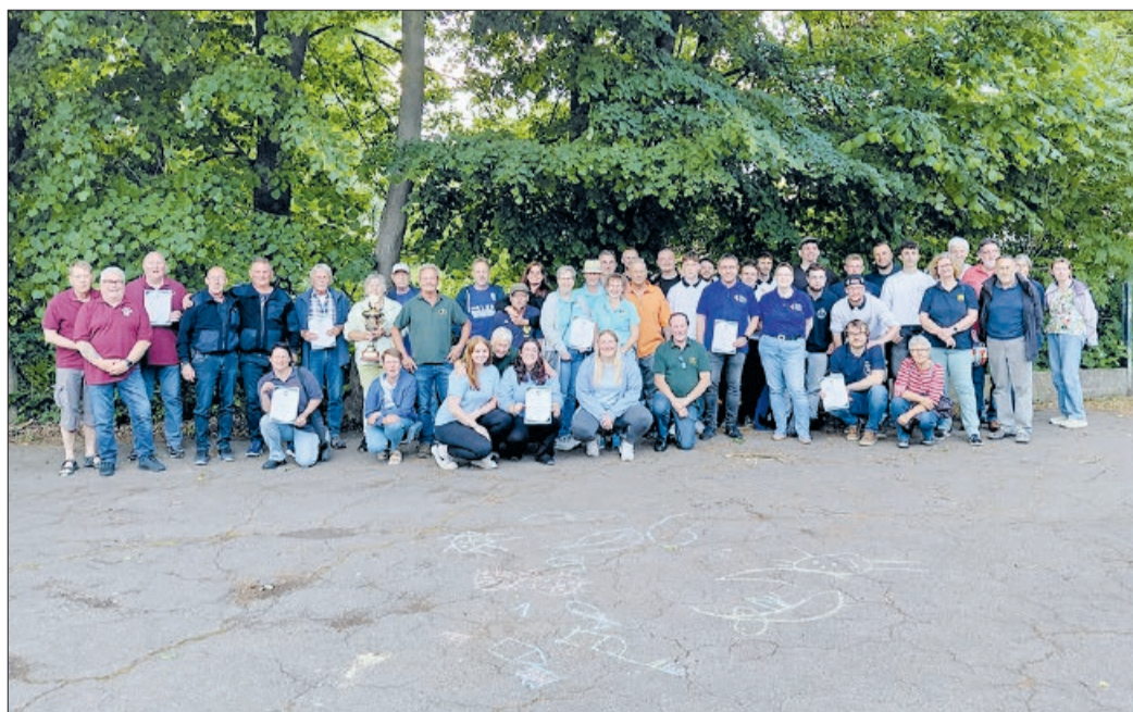
Beim Wettkampf um den Wanderpokal schickten die Vereine sechs Personen ins Rennen und in die Wertung kamen nun die drei Besten.

Ölsburg. Auf Einladung des Schützenvereins 1905 Ölsburg traten im Mai 2026 traditionell die in Ölsburg beheimateten Vereine in einen Wettstreit gegeneinander. Am sogenannten Sichtungsschießen auf Ringteiler beteiligten sich 116 Schützen bzw. Schützinnen aus neun Vereinen. Es kamen die sechs besten Schützen*innen jedes Vereins in die Wertung. Der bestmögliche Einzelwert mit sogenannten 10er-Streifen lag bei 109,0 Ringteiler.