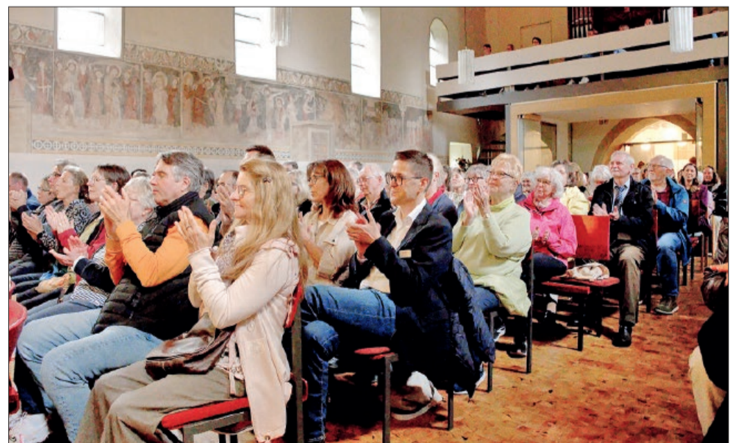
Das Publikum sparte nicht mit Beifall und belohnte die Musiker nach über zwei Stunden Konzertprogramm und mehreren Zugaben begeistert mit Standing Ovations.