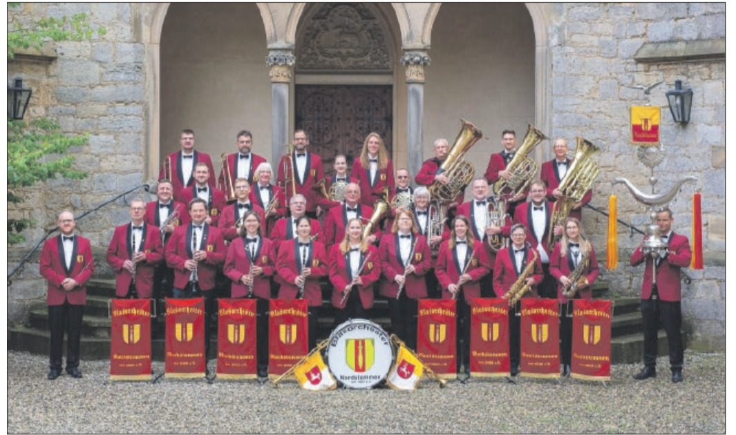
Blasorchester Nordstemmen von 1883 e. V.