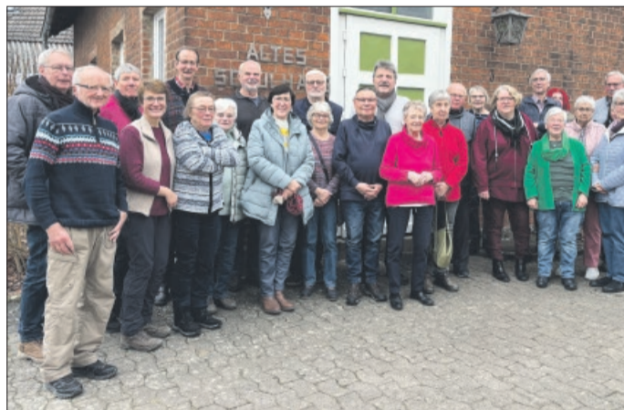
Wanderer des VfL Heyersum

Besonders stolz sind wir auf die gelungene Verbindung von Tradition und Weiterent-