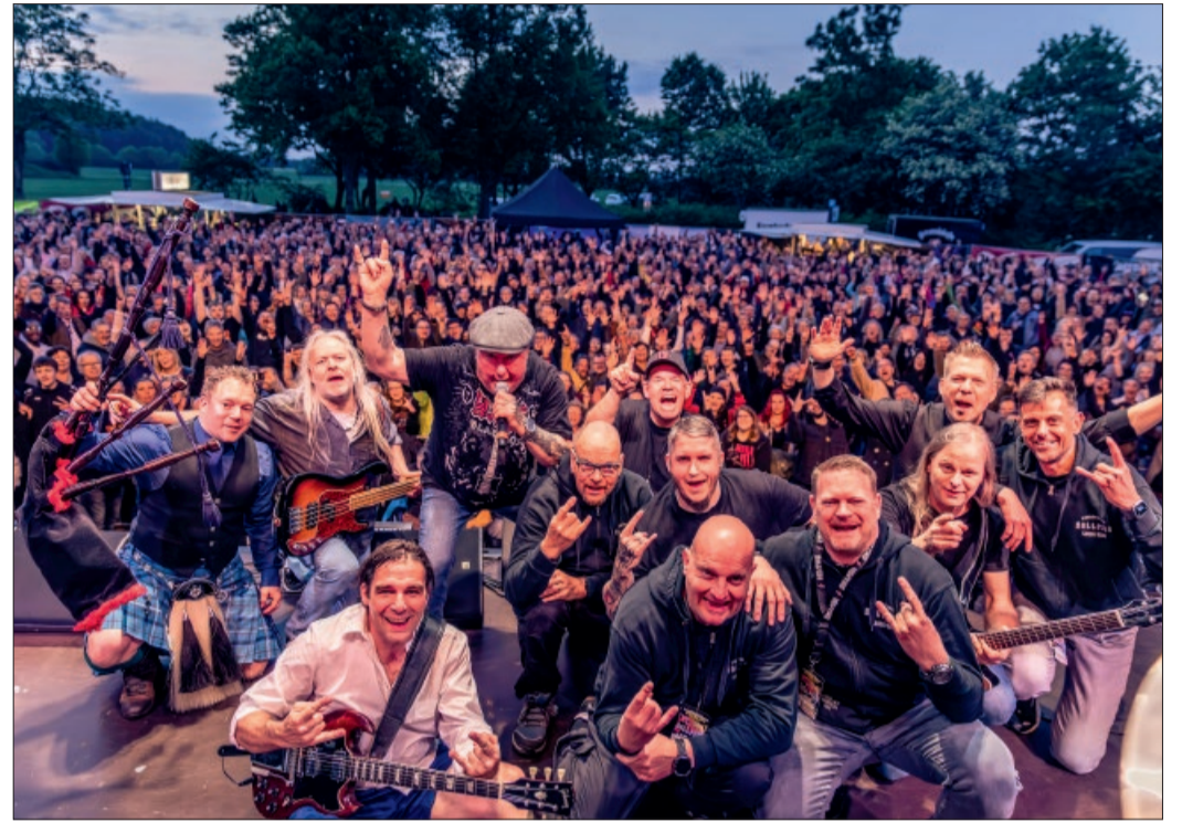
Die Band HELLFIRE hat sich in den vergangenen 22 Jahren zu einer der bekanntesten AC/DC-Tributebands Deutschlands entwickelt. Mit der 17. Nordstemmer Rocknacht begeisterten die Musiker erneut ein ausverkauftes Publikum vor der eindrucksvollen Kulisse der Marienburg.

Für die passende Atmosphäre hatten die Veranstalter erneut keine Mühen gescheut. Eine eigens