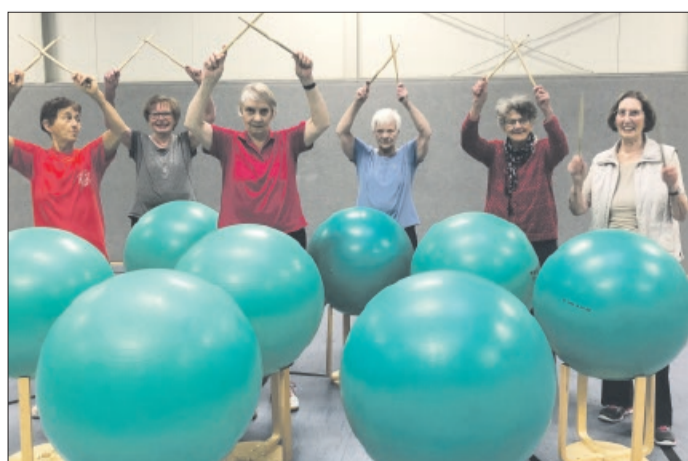
Drums & More-Gruppe während der Übungsstunde